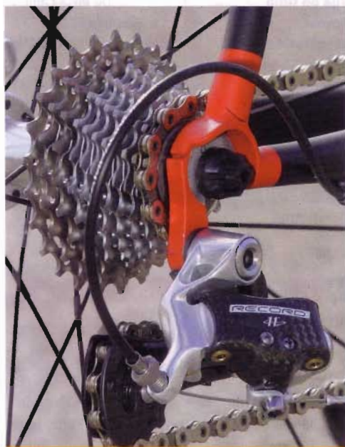
Las punteras, pintadas de diferente color, son otro elemento distintivo de la Neo Pro.

virar y un confort que nos hace bajar relajados aunque sea a gran velocidad. No podemos dudar que la Neo Pro es polivalente ante todo porque ofrece un excelente resultado para la competición, pero con un desarrollo adecuado también es apta para el cicloturismo. Seguramente su único punto débil está en el precio no apto para algunos bolsillos, pero De Rosa es una marca elitista y eso se paga también. Si este montaje con Campagnolo Record 11 v. que supera los 6.000 euros es demasiado para algunos, también se puede encontrar a partir de 4.745 euros con Centaur, aunque los que quieran aún más la tienen asimismo con SuperRecord 11v. por poco más de 7.000 euros. Como no, también se puede adquirir el cuadro suelto por algo menos de 3.000 euros.