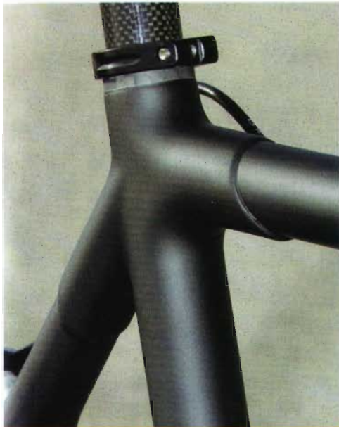
Los racores en la unión de los tubos le dan una imagen clásica.