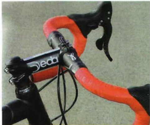
Los componentes del montaje no podían ser sino de calidad con marcas como Deda, que se encarga del puesto de pilotaje.