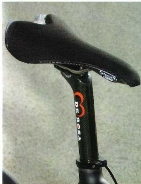
Este original sillín es de la marca Gpiemme, que también aporta las ruedas y cuyo resultado es de aplaudir.