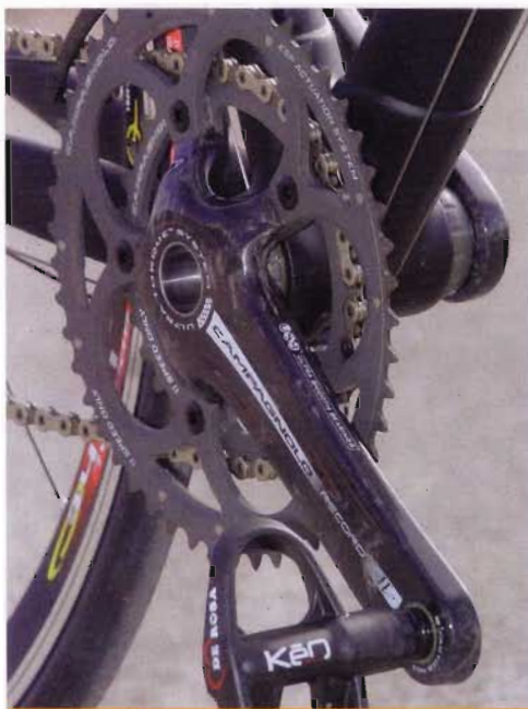
El grupo Campagnolo 11 v. es excelente y sus diferentes opciones de desarrollo contentarán a todos los usuarios.